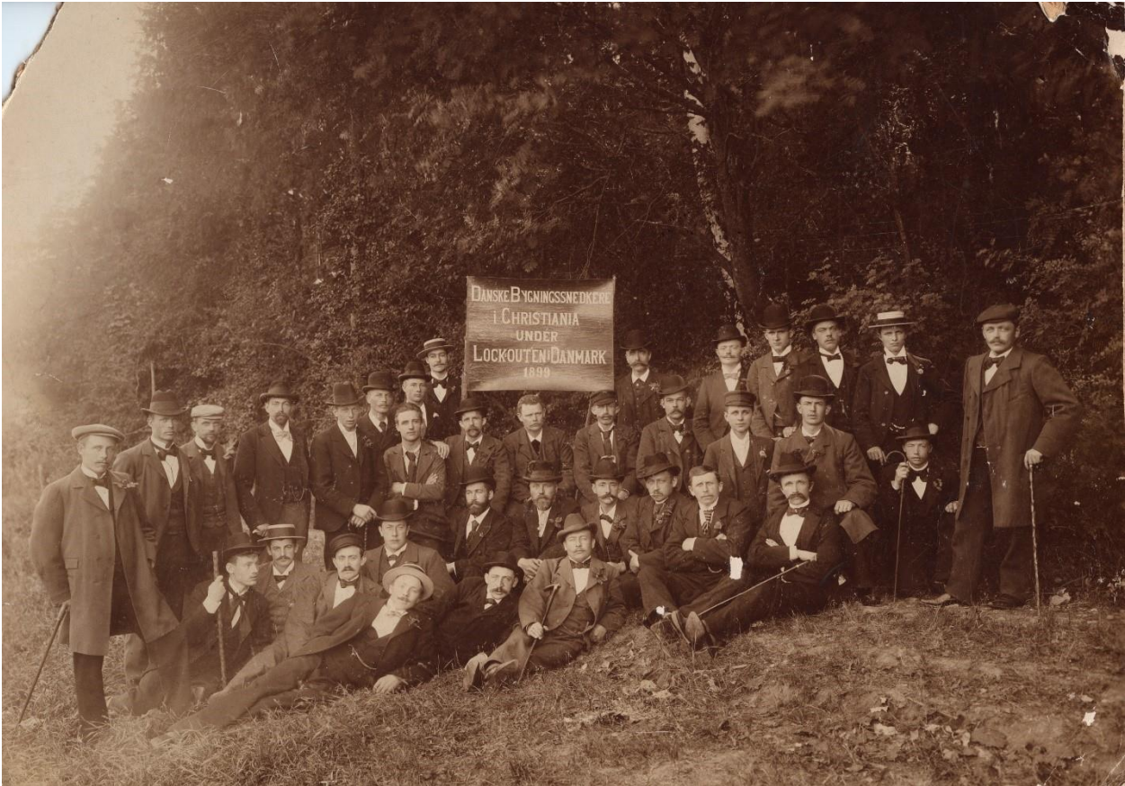
Lockout: Bygningssnedkere blev fotograferet i Kristiania (det nuværende Oslo) under den store lockout i 1899. Mange lockoutede arbejdere rejste til udlandet for at arbejde og sendte penge hjem til kollegerne.