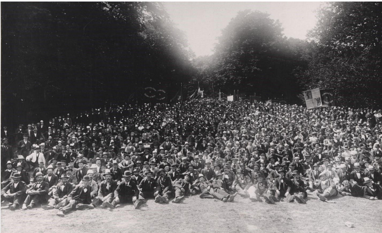
1 Demonstration: Under lockouten blev der løbende afholdt demonstrationer og andre aktioner. Her ses arbejdsmændenes udflugt til Ulvedalene under lockouten i 1899.

Når man som dansk lønmodtager ser sin lønseddel 125 år senere i 2024, kan man takke de udsultede lockoutede arbejdere fra 1899, hvis kamp har givet os retten til fagforeningsmedlemskab og de kollektive overenskomster, som blandt andet har sikret fair løn, ferie, og barsel.