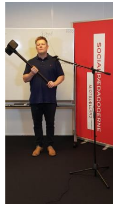
Temaaften om kunsten at brokke sig - hjemme i stuen og fra kredsens "studie"