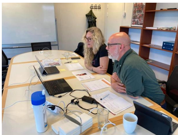
Socialpædagogerne og BUPL holder digitalt dimittendmøde